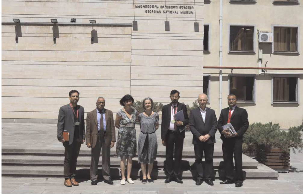
जार्जिया के पुरातात्विक धरोहरों के सांस्कृतिक भ्रमण के लिए संग्रहालय के भ्रमण पर परिषद् तथा जार्जिया के अधिकारी गण।