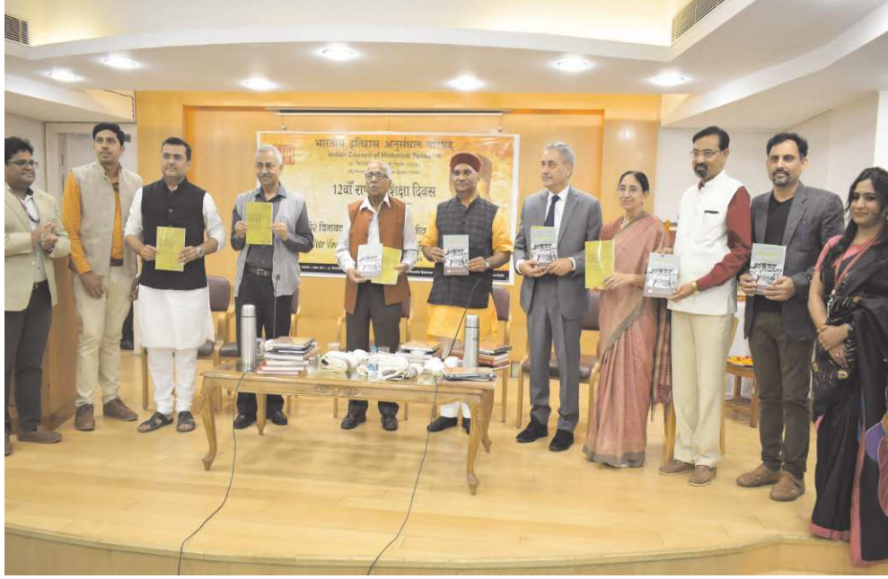
12वें राष्ट्रीय शिक्षा दिवस के मौके पर वीर विनायक दामोदर सावरकर : जीवन और लक्ष्य विषयक एक दिवसीय परिसंवाद अवसर पर परिषद् के प्रकाशनों का विमोचन करते अतिथि एवं अधिकारी गण।