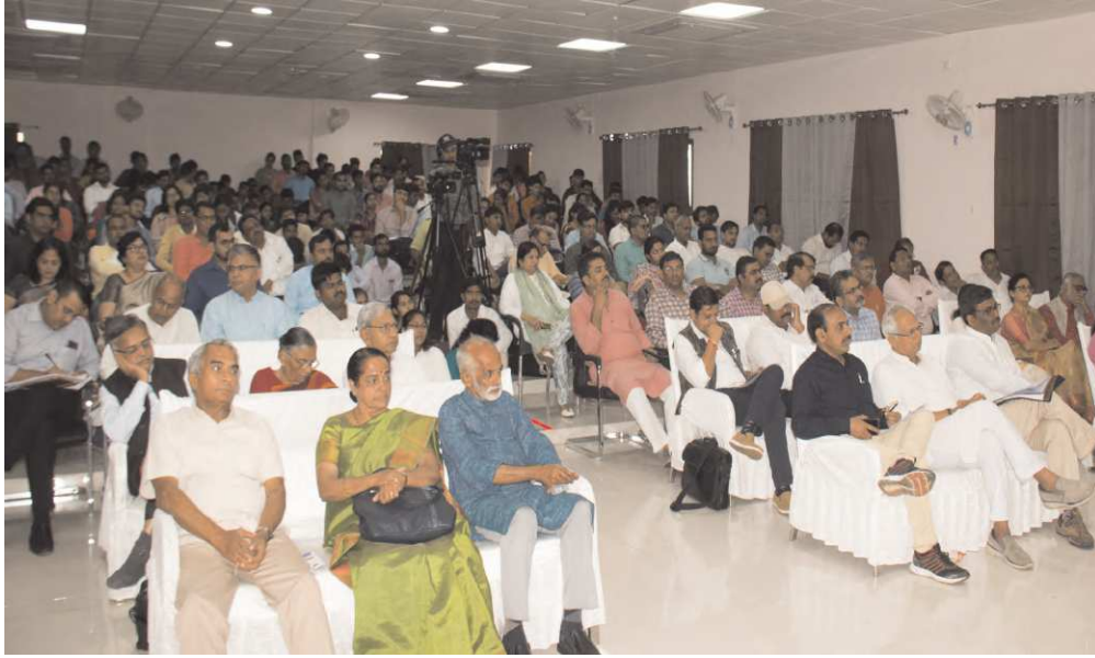
गांधी और उनकी सामाजिक प्रासंगिकता : समाज, संस्कृति एवं स्वराज पर आयोजित संगोष्ठी के दौरान सभागार में उपस्थित इतिहासकार, शोधार्थी व अन्य।