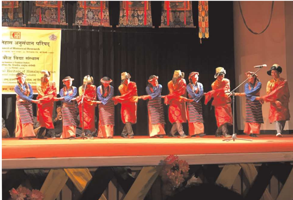
लद्दाख की संस्कृति, धरोहर तथा इतिहास विषय पर केन्द्रित तीन दिवसीय राष्ट्रीय संगोष्ठी के प्रथम दिवस की पूर्व संध्या पर लद्दाख की लोक संस्कृति से ओत-प्रोत प्रस्तुति देते कलाकार।